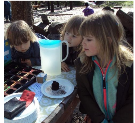
Figur 5: Der sås diverse.

Store gruppen: Der vil være fokus på samarbejdsøvelser og evt., ture ud af huset.