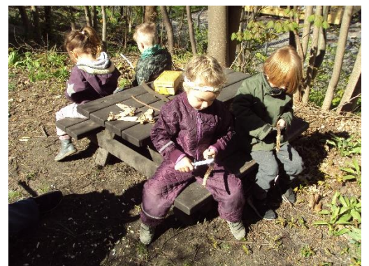
Figur 7: Natur-dag – Der snittes.