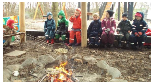
Figur 6: Bål-dag (natur-dag). - Der laves popcorn.